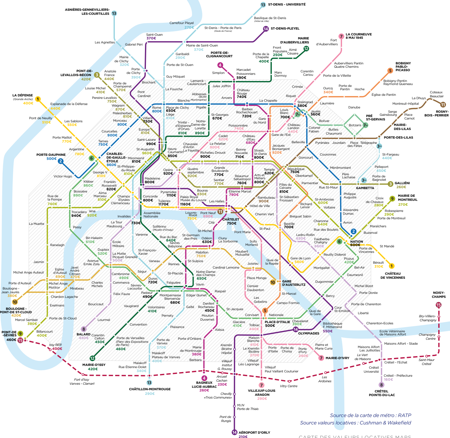
Source de la carte de métro : RATP Source valeurs locatives : Cushman & Wakefield