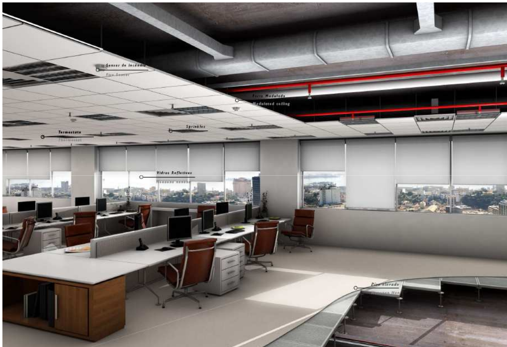
Perspectiva meramente ilustrativa podendo sofrer alterações de cores e acabamentos.