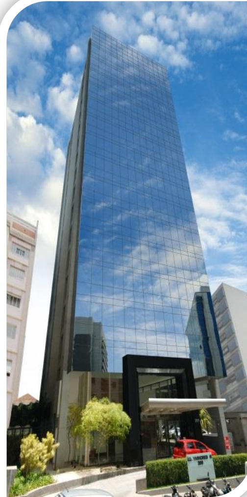
Fachada do Ed. Varicred III