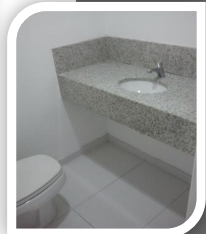
Sanitário do C. 132.